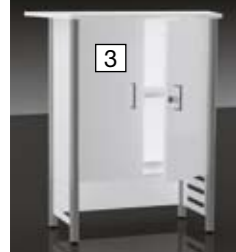
Rückansicht des Counters mit Flügeltüren