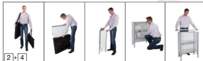
Counter: Transport und Aufbau